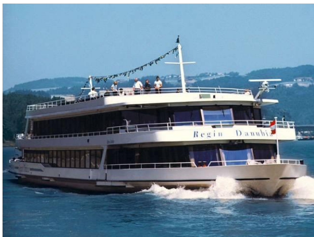
MS „Regina Danubia“, das Galaschiff der Donauschiffahrt Wurm+Köck

kann man hier dem Fahrer doch so manche mystische Sage entlocken. Das Ufer ist schnell erreicht. Auf dem Donauradweg geht es mit dem Drahtesel 14 Kilometer lang weiter Richtung Schlögener Schlinge. Vorbei an Burgruinen, bewaldeten Uferhängen und zahlreichen Heurigen, die zum Einkehren einladen, erreichen wir nach einer Stunde den Ort Au. Dort überqueren wir die Donau