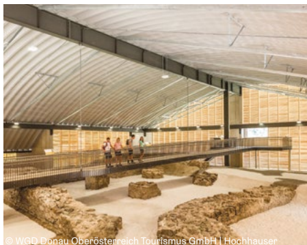
© WGD Donau Oberösterreich Tourismus GmbH | Hochhäuser

Besuchen Sie das am besten erhaltene römische Bauwerk Oberösterreichs, den „Römerburgus Oberranna“ und erfahren Sie dabei u.a. wofür das Untergeschoss im Nordturm früher genutzt wurde. Anschließend erfahren Sie bei einer Zillenfahrt an der Donau mehr über den Schiffsbau und bei einer Verkostung spüren Sie, wie die Römertrauben heute am Gaumen prickeln.